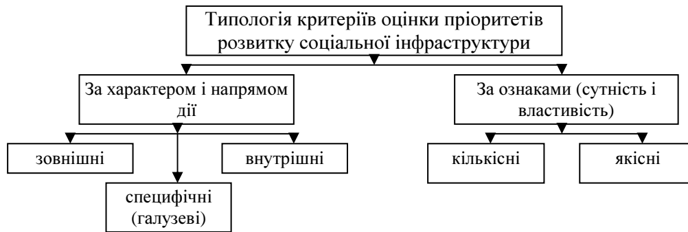
Рис. 1. Узагальнена типологія критеріїв виокремлення пріоритетів соціальної інфраструктури

Так, критеріальна характеристика розвитку соціальної інфраструктури може бути представлена такою типологією індикаторів: група зовнішніх, внутрішніх і специфічних критеріїв. До групи зовнішніх критеріїв-індикаторів можна віднести: особливості і специфіку процесів світової глобалізації; конкурентні позиції країни на світовому ринку; світові тенденції соціально-економічного розвитку; тенденції та рівень міжнародних зв'язків; участь у світових економічних організаціях; сформованість міжнародного співробітництва; рівень розвитку транскордонного співробітництва; характер процесів регіоналізації. До типу внутрішніх критеріїв, які формують соціально-економічний розвиток, зокрема, соціальної інфраструктури, належать: загальна економічна ситуація; рівень економічного розвитку; загальна політична ситуація в країні; тенденції соціального розвитку і фінансово-кредитна та податкова політика; ступінь сформованості ринку; демографічні тенденції; рівень безробіття; особливості розподілу та розміщення населення; активність інвестиційно-інноваційної діяльності; зміни законодавчо-нормативного характеру; зрушення у фундаментальній науці, технологіях, техніці; зміни режимів господарювання.