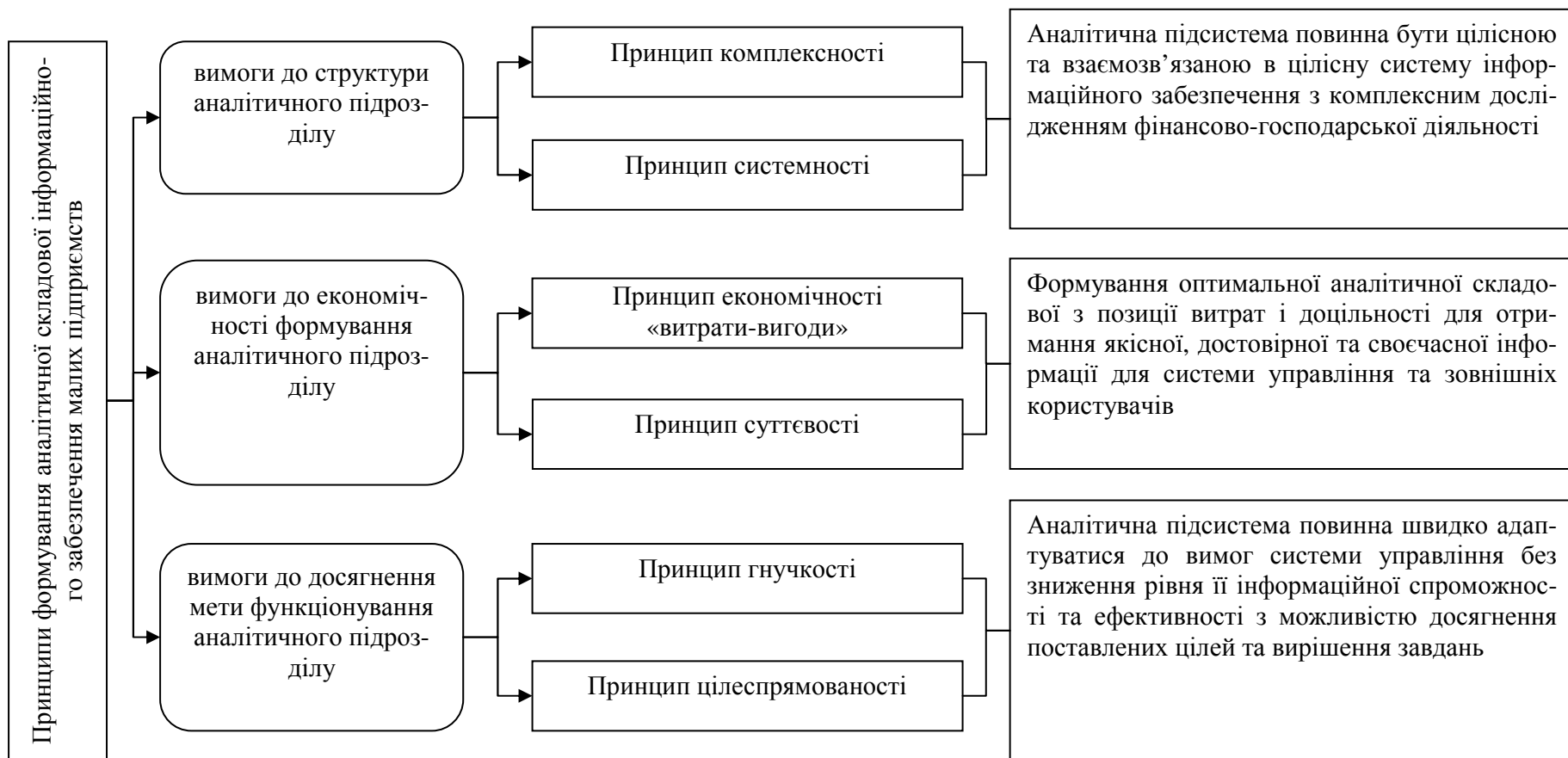
Рис.1. Принципи формування аналітичної складової в системі інформаційного забезпечення системи управління*