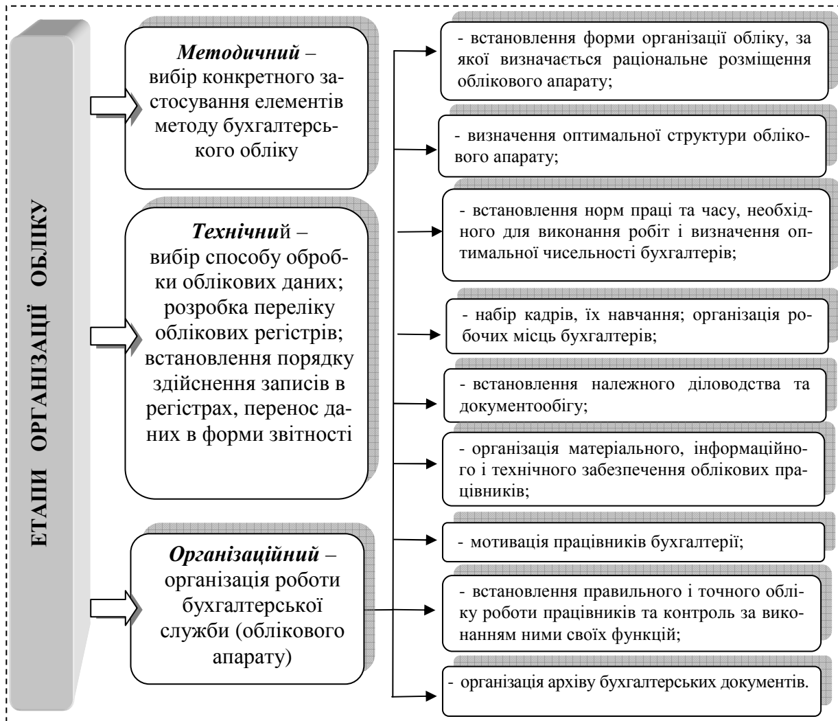
Рис. 1 Основні етапи організації обліку на підприємстві

Раціональна організація обліку базується на принципах, які направлені на досягнення єдиної мети – забезпечення оперативною, достовірною та перевіреною інформацією внутрішніх та зовнішніх користувачів (рис. 2) [6, 10].