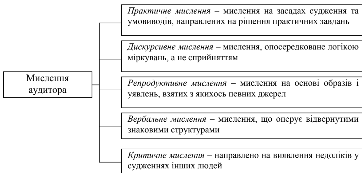
Рис.1. Характеристика мислення аудитора

Виходячи з класифікації мислення в психології, аудиторське мислення можна охарактеризувати, як практичне, дискурсивне, репродуктивне, вербальне, критичне (рис. 1).