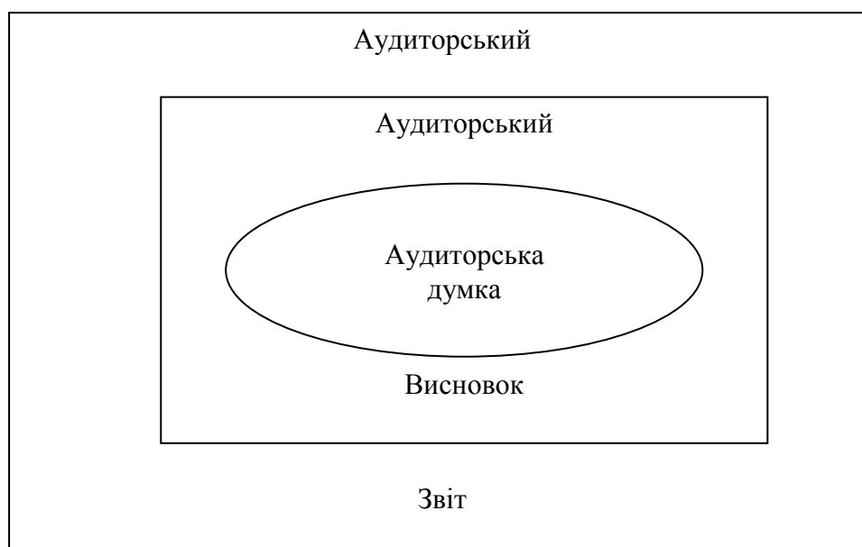
Рис. 4. Наочне подання відношення підпорядкування понять аудиту

На нашу думку, ці поняття мають відношення підпорядкування , де зміст одного поняття складає частину іншого, а обсяг одного із понять входить до складу іншого поняття як частина його обсягу. Так, найбільш широким (підпорядковуючим) поняттям є «аудиторський звіт», до якого входить поняття «аудиторський висновок». А «аудиторська думка» є підпорядкованим поняттям як частині (останній абзац) аудиторського висновку (звіту) (рис. 4).