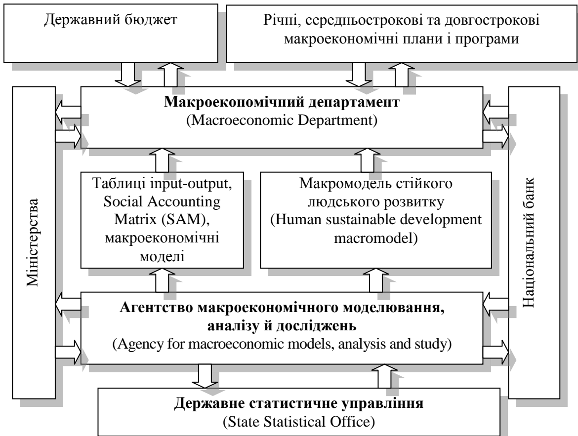
Рис. 1. Структура інституційної системи індикативного планування Республіки Македонія Джерело: складена на основі [3].

Проблемам індикативного планування присвячені роботи і російських учених [1; 5-8], які розглядають індикативне планування як механізм координації інтересів і діяльності державних і недержавних суб'єктів управління економікою, який поєднує її державне регулювання з ринковим та неринковим її саморегулюванням і ґрунтується на розробленні системи показників (індикаторів) соціально-економічного розвитку. На думку С.М. Лавлінського [8, с. 12-13], індикативне планування – це процес формування системи індикаторів, що характеризують стан і розвиток економіки, в сукупності з механізмами державного регулювання соціально-економічних процесів, які забезпечують досягнення цільових значень індикаторів.