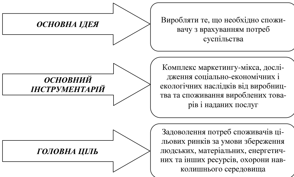
Рис. 1. Основні положення концепції соціально-етичного маркетингу

гу вимагає збалансованості трьох чинників: прибутків підприємства, купівельних потреб і інтересів суспільства (рис. 1).