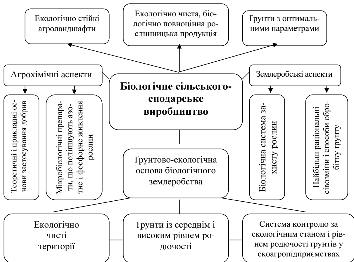
Рис. 2. Модель біологічного землеробства

По-друге, принцип екології. Органічне сільське господарство має ґрунтуватися на принципах взаємоіснування природних екологічних систем і циклів, працюючи з ними й підтримуючи їх.