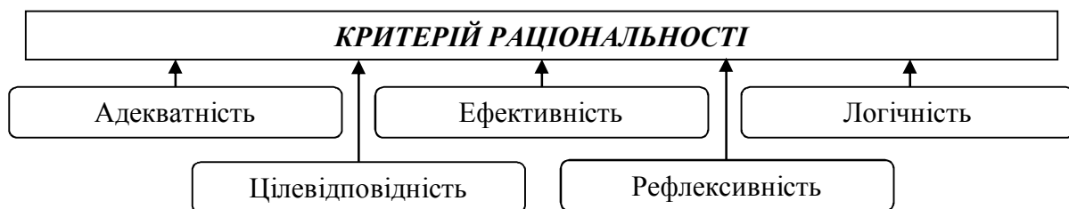
Рис. 1. Ознаки критерію раціональності

На початковому етапі дослідження найбільш продуктивним є прийом, згідно з яким описуються найбільш істотні характеристики явища, що вивчається. Окремі риси цих характеристик дозволять сформулювати критерії, за якими можна відрізнити раціональне від його антиподів – нераціонального, позараціонального, ірраціонального, що дозволяє максимізувати синергетичний ефект при мінімізації витрат. Основні риси, які визначають критерій раціональності, наведені на рис. 1.