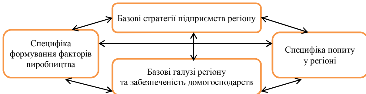
Рис. 1. Концепція конкурентоспроможності регіону (адаптована до концепції конкурентоспроможності Портера)

Для формування дефініції «конкурентоспроможність регіону» доцільним є наведення концепцій щодо трактування цього поняття, починаючи з найбільш класичного підходу до концептуалізації конкурентоспроможності Портера [4], через проведення її адаптації з врахуванням належності до певного регіону (рис. 1).