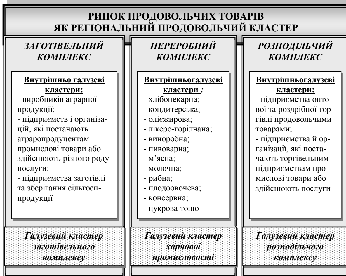
Рис. 1. Ринок продовольчих товарів як регіональний продовольчий кластер

Продукція, яка використовується населенням і призначена в першу чергу для особистого та суспільного споживання, визначається як споживчі товари. Найбільшу частку у структурі споживчих товарів останнім часом становлять харчові продукти. Відсутність зростання доходів більшої частини населення, викликане економічною та політичною нестабільністю у країні, що вплинуло на зміну структури виробництва споживчих товарів, спрямованих насамперед на придбання продуктів харчування (рис. 1).