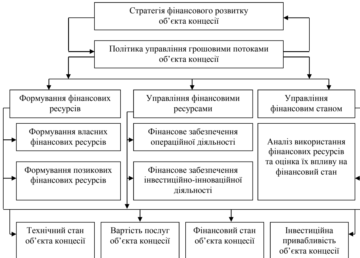
Рис. 1. Політика управління грошовими потоками об'єкта концесії

Серед основних принципів управління грошовими потоками під час здійснення концесійної діяльності слід виділити такі: