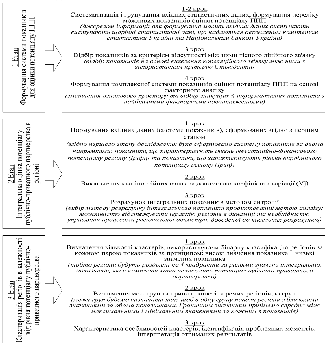
Рис. 2. Методичний підхід до оцінювання потенціалу публічно-приватного партнерства в регіонах України Джерело: складено автором.

Отже, для адекватної оцінки потенціалу публічно-приватного партнерства пропонуємо використання методичного підходу (рис. 2), який складається з трьох взаємопов'язаних послідовних етапів.