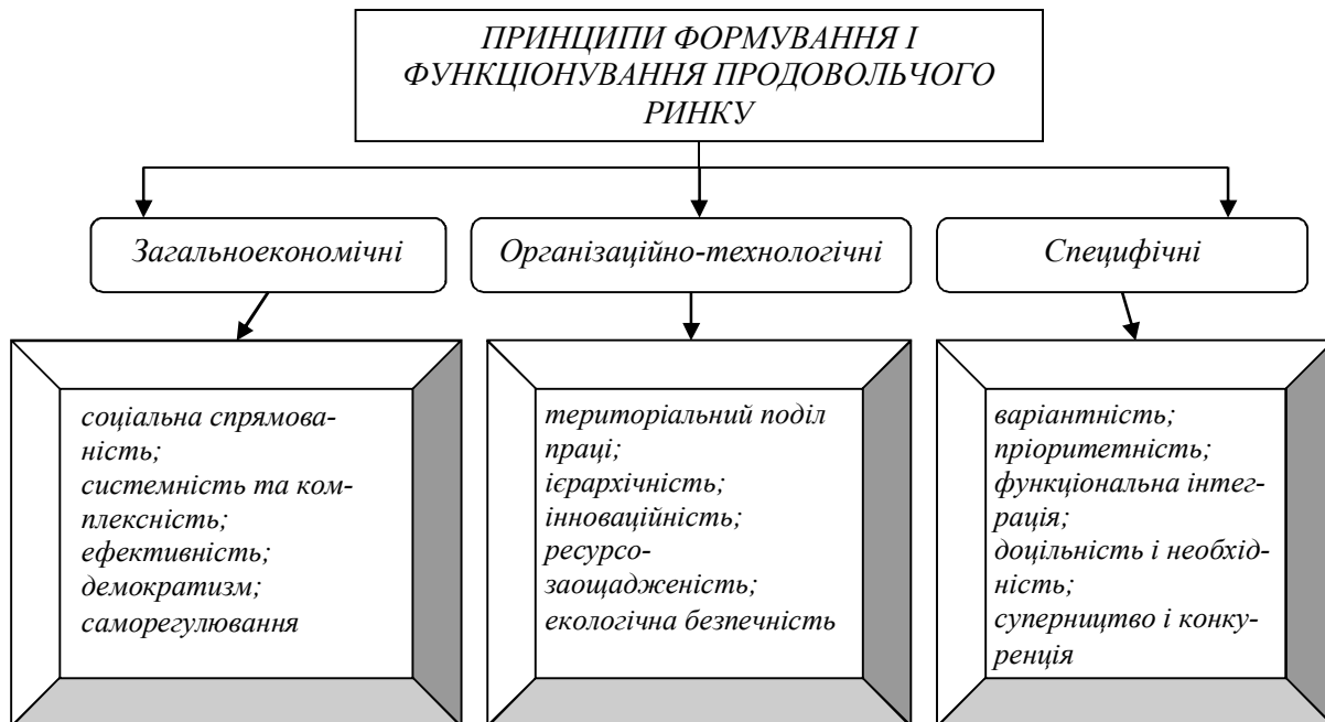
Рис. 1. Принципи формування і функціонування продовольчого ринку

Розкриття сутності продовольчого ринку вимагає розгляду його меж. Ці межі визначаються ступенем взаємозалежності показників у просторі і в часі. У зв'язку з цим розрізняють товарні (продуктові), географічні (локальні) та часові (сезонні) межі товарних ринків (рис. 2). Товарні межі продовольчого ринку пов'язані із взаємозамінністю споживчих товарів. М'ясо птиці стало заміником для більшості споживачів м'яса інших видів тварин з огляду на те, що останніми роками відбувається суттєве скорочення пропозиції м'яса великої рогатої худоби та свиней, а відповідно ціни на них зростають. Крім того, чимало споживачів змінило свої смаки і вподобання відносно того чи іншого м'яса на користь дієтичного м'яса птиці. Сезонні межі ринку визначаються позитивною кореляцією руху цін на м'ясо-молочну продукцію в літньо-осінній та зимово-весняний періоди. Визначення географічних або територіальних меж ринку залежить від наявного конкурентного середовища в галузі (продавців на національному і міжнародному ринках) та вхідних бар'єрів проникнення на ринок.