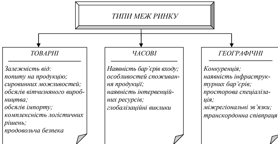
Рис 2. Типізація меж продовольчого ринку

Структура національного продовольчого ринку, основу якого складають сировинні галузі АПК, під впливом вертикальної інтеграції суттєво ускладнюється. Ознаками його будови є не тільки галузі, що формують технологічний процес, а й територіальне розміщення підприємств, рівень управління та функціональна спеціалізація окремих підрозділів. Серед підходів до характеристики структури продовольчого ринку можна виділити три основні: продуктовий, територіальний і функціональний.