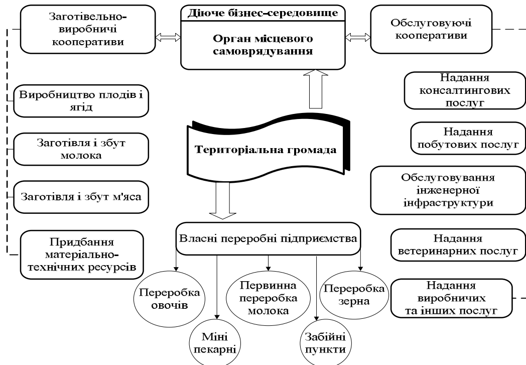
Рис. 1. Схема активізації економічного розвитку територіальних громад

Основними перевагами об'єднання дрібних сільськогосподарських товаровиробників є: