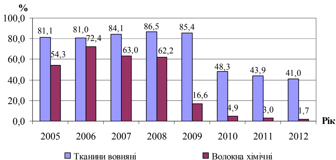
Рис. 1. Питома вага основної продукції текстильного виробництва Чернігівської області в Україні

Проте частка основної продукції текстильного виробництва Чернігівської області в Україні з кожним роком зменшується, що свідчить про занепад галузі та вказує на необхідність її відродження. Зокрема, відбулося значне скорочення частки виробництва вовняних тканин (на 37,1 %) у 2010 році та хімічних волокон (на 45,6 %) у 2009 році (рис. 1).