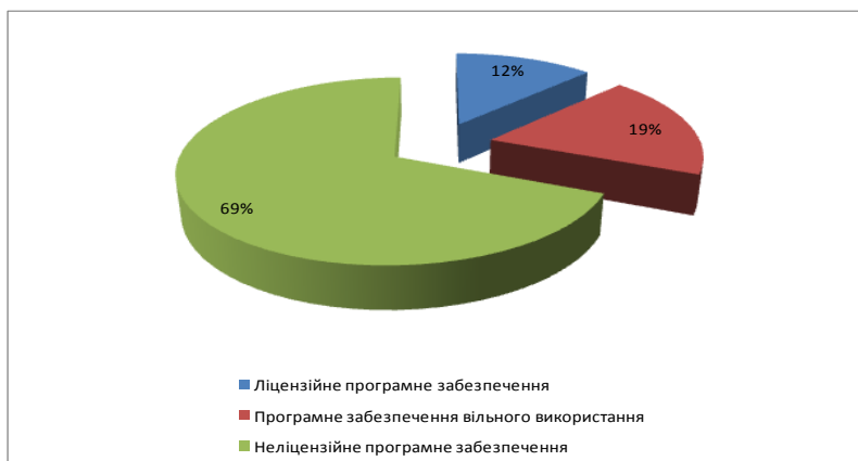
Рис. 3. Використання ліцензійного програмного забезпечення в апараті облдержадміністрації та райдержадміністрацій

Дослідження свідчать, що майже 70 % програмного забезпечення, яке використовується в апараті обласної державної адміністрації та районних державних адміністраціях є неліцензійним. Деякі прикладні програми, які необхідні для виконання спеціальних завдань, насамперед антивірусні, на жаль, неліцензійні. Оскільки немає фінансової можливості закупити необхідну кількість ліцензійних копій відповідного програмного забезпечення, а також оплачувати оновлення версій.