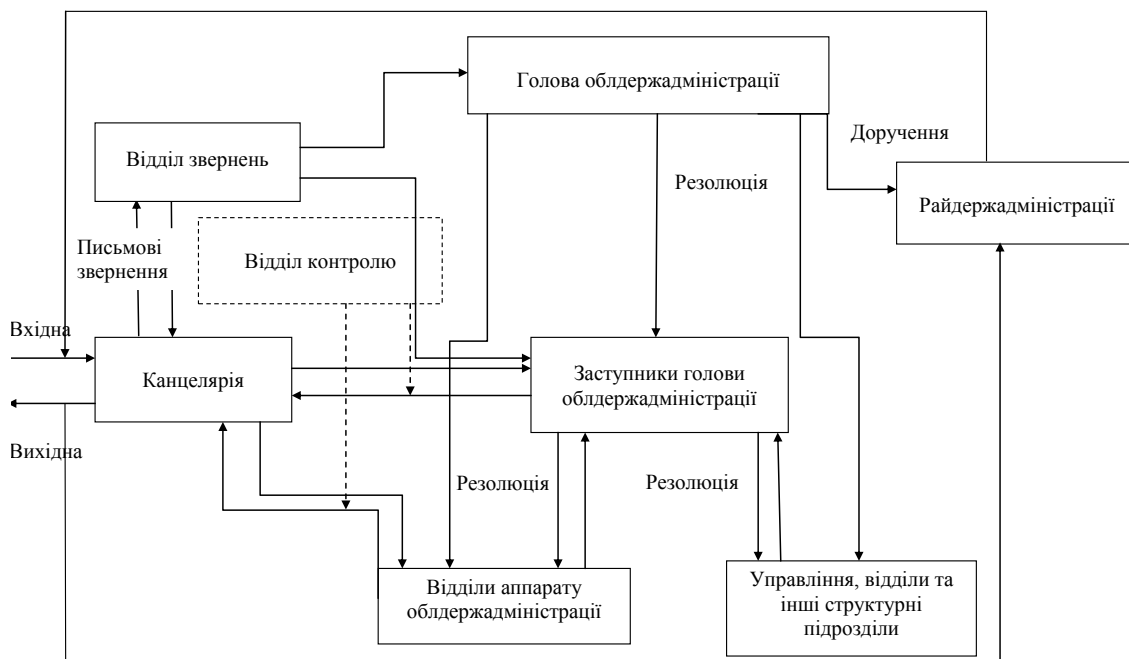
Рис. 1. Схема проходження документів в апараті облдержадміністрації

Зовнішня інформація надходить до канцелярії апарату обласної державної адміністрації, після реєстрації спрямовується до заступника голови, а письмові звернення спрямовуються до відділу звернень, а далі до голови, або його заступника. Голова після розгляду і накладання певних резолюцій спрямовує інформацію заступнику, у відділи апарату облдержадміністрації, управління, відділи та інші структурні підрозділи, а також надає доручення до райдержадміністрацій. Заступник голови після розгляду спрямовує кореспонденцію у функціональні підрозділи на подальше опрацювання. Після опрацювання й отримання необхідних підписів керівництва обласної державної адміністрації інформація через канцелярію спрямовується до відповідних адресатів.