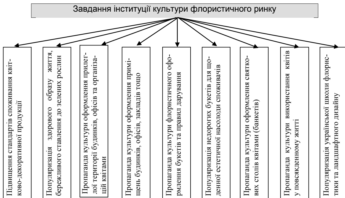
Рис. 3. Завдання інституції культури флористичного ринку

Для формування культури споживання та підвищення попиту на продукцію квітництва доцільно продовжувати роботу щодо проведення виставок та фестивалів квітів; конкурсів озеленення прилеглої території житлових будинків, підприємств, навчальних закладів; телевізійні передачі; майстер-класи по фітодизайну, ландшафтному дизайну; залучати квіткарів до спонсорства на громадських заходах тощо (рис. 3).