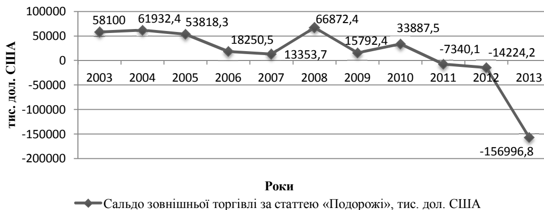
Рис. 2. Сальдо зовнішньої торгівлі України за статтею «Подорожі» у 2003–2013 рр., тис. дол США

Важливим напрямом стимулювання національної економіки повинен стати розвиток туризму в межах країни, який являє собою сукупність в'їзних та внутрішніх туристичних потоків. Разом з тим в'їзний туризм суттєвим чином позитивно впливає на формування дохідної частини державного бюджету та є вагомим джерелом валютних надходжень до економіки країни за рахунок туристичних витрат від іноземних та внутрішніх туристів.