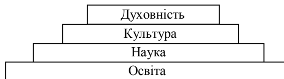
Рис. 1. Структурні компоненти інтелектуального потенціалу

Виклад основного матеріалу. Структурно інтелектуальний потенціал представлений такими компонентами, як освіта, наука, культура та духовність. Авторське розуміння внутрішньої структури інтелектуального потенціалу ґрунтується на таких припущеннях. По-перше, кожен структурний елемент інтелектуального потенціалу містить багато спільних ознак, як, наприклад, пізнання, розум, проникливість, креативність, що робить його визначальним фактором економічного зростання та конкурентним чинником у міжнародній конкурентній боротьбі. По-друге, всі компоненти інтелектуального потенціалу за своїми функціональними характеристиками не лише доповнюють один одного, а поступово долучаються до процесу його формування і подальшого зростання. Схематично процес формування інтелектуального потенціалу із послідовним залученням усіх компонентів представлено на рис. 1.