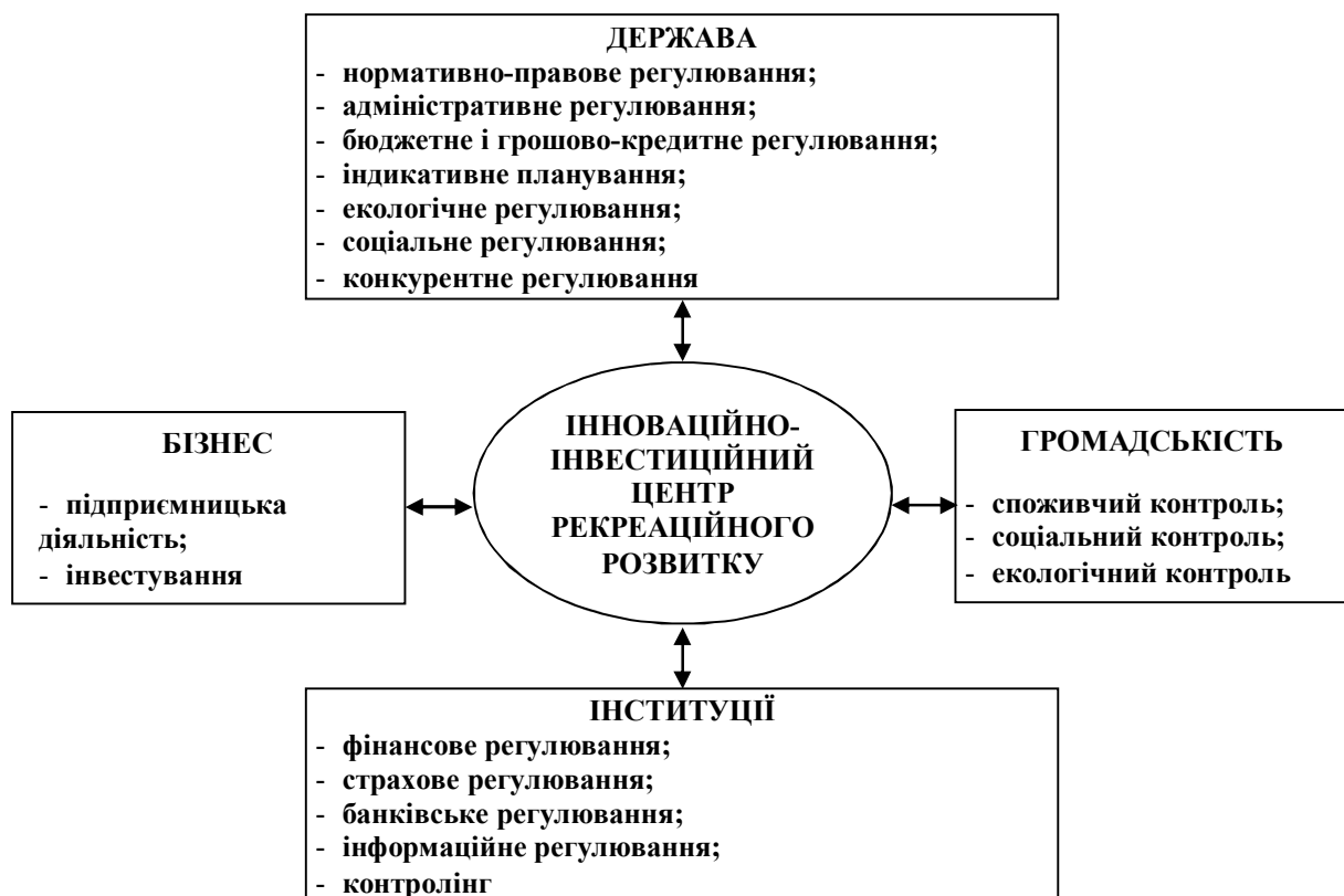
Рис. 4. Взаємодія основних суб'єктів рекреаційної діяльності

З метою підвищення конкурентоспроможності регіональних господарських систем у сфері рекреації доцільним є створення центру розвитку рекреаційного потенціалу, функціонування якого здійснюватиметься на партнерських засадах між органами місцевого самоврядування, представниками бізнесу, науковими й освітніми закладами і громадськістю. Виступаючи координаційним центром він забезпечує балансування інтересів основних суб'єктів рекреаційної діяльності (рис. 4).