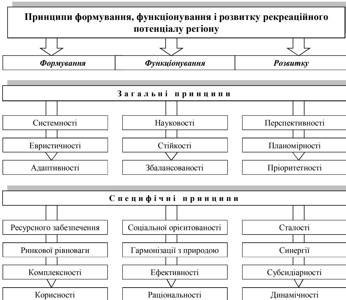
Рис. 2. Базові принципи, що визначають ефективність реалізації рекреаційних можливостей регіону

Принцип науковості – функціонування рекреаційного потенціалу повинно здійснюватися у взаємозв'язку з останніми тенденціями в науці. Передбачає використання науково обґрунтованих методів оцінювання, аналізу сучасного стану та прогнозування розвитку рекреаційного потенціалу, впровадження інноваційних технологій для підвищення ефективності і раціональності його використання.