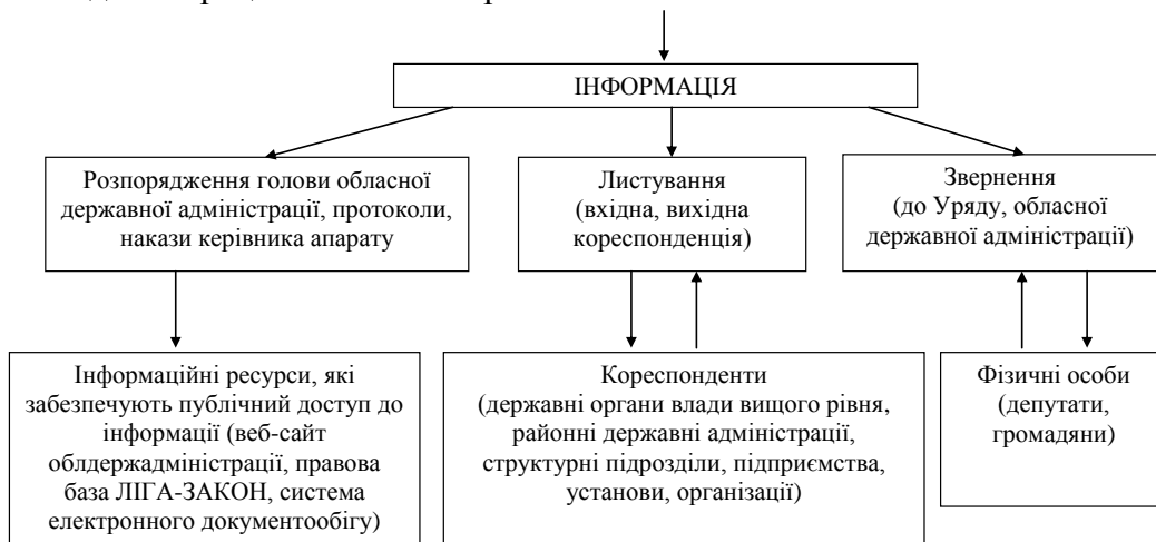
Рис. 1. Структурна схема інформації, що курсує в обласній державній адміністрації

тупу. На рисунку 2 відображена динаміка розпоряджень, зареєстрованих в обласній державній адміністрації за 2006-2011 роки.