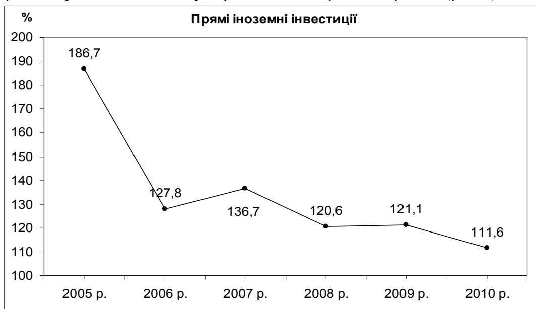
Рис. 1. Індекси прямих іноземних інвестицій до попереднього періоду [10]

Нестабільна соціально-економічна ситуація у країні та її регіонах суттєво гальмує процеси залучення у регіон прямих іноземних інвестицій, про що свідчить зменшення у 2010 р. індексу цього показника у порівнянні з попереднім періодом (рис. 1).