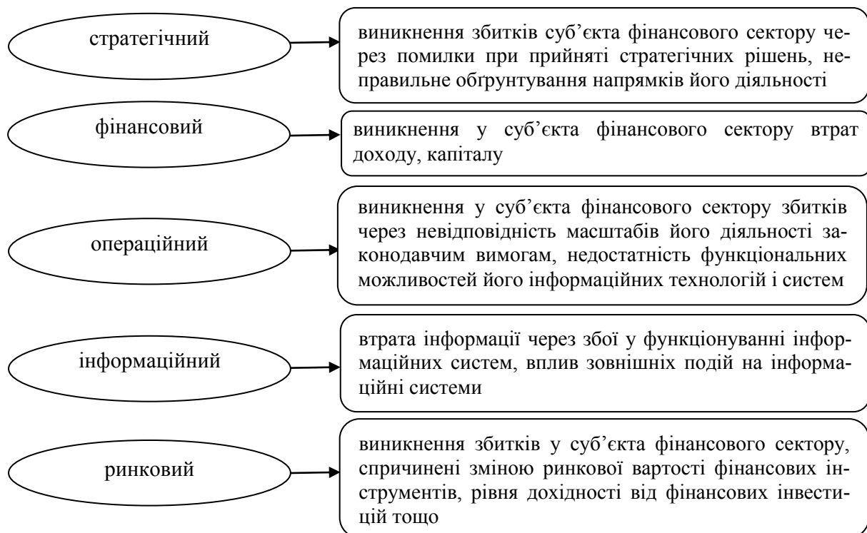
Рис. 2. Ризики діяльності суб'єктів фінансового сектору та форми їх прояву

Характерні ризики, що виникають у процесі діяльності суб'єктів фінансового сектору, та форми їх прояву наведено на рисунку 2.