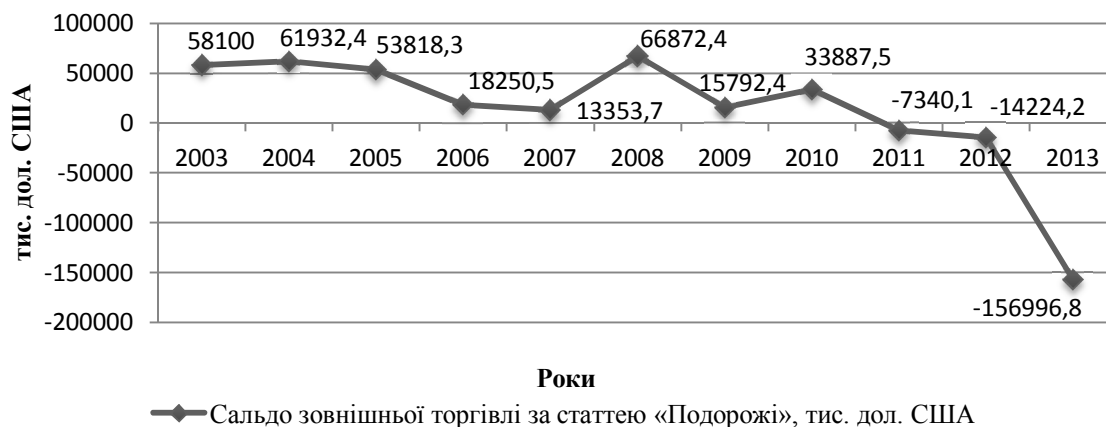
Рис. 2. Сальдо зовнішньої торгівлі України за статтею «Подорожі» у 2003–2013 рр., тис. дол США

Важливим напрямом стимулювання національної економіки повинен стати розвиток туризму в межах країни, який являє собою сукупність в'їзних та внутрішніх туристичних потоків. Разом з тим в'їзний туризм суттєвим чином позитивно впливає на формування дохідної частини державного бюджету та є вагомим джерелом валютних надходжень до економіки країни за рахунок туристичних витрат від іноземних та внутрішніх туристів.